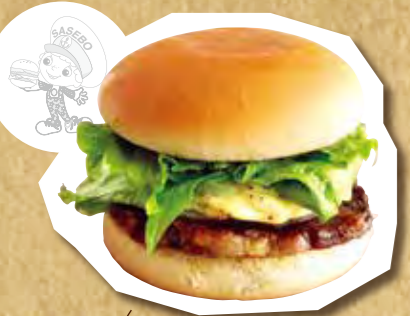
ステーキバーガー 570円(税込)