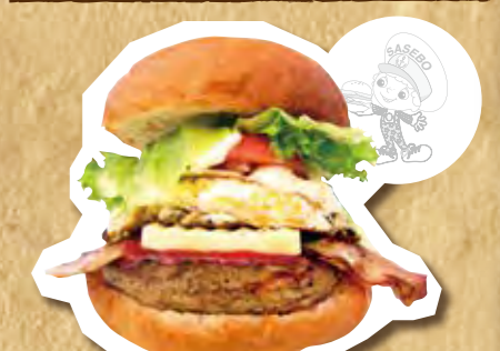
スペシャル佐世保バーガー 700円(税込)