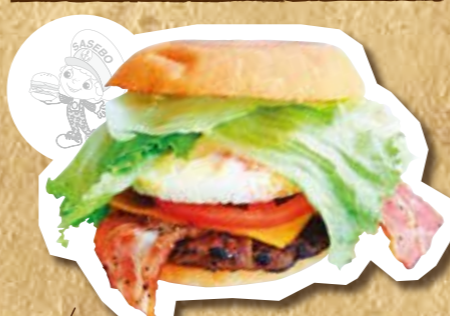
もみじのスペシャル佐世保バーガー 600円(税込)