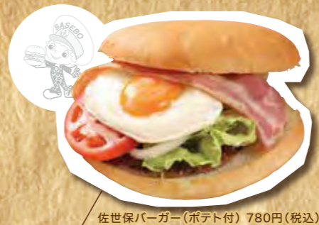
佐世保バーガー(ポテト付) 780円(税込) ※お持ち帰りバーガー 680円(税込)