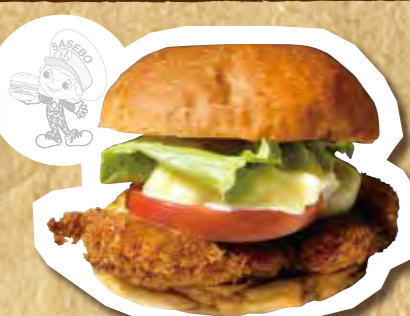
大きなりやきチキンカツバーガー 500円(税込)