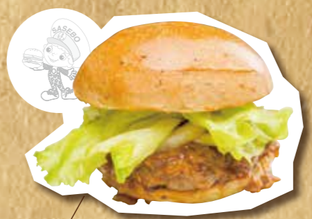
長崎和牛プレミアムバーガー 980円(税込)