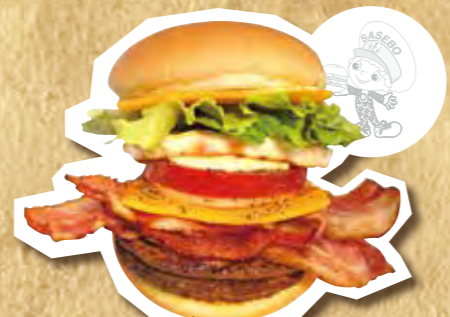
極撰バーガー 1,150円(税込)