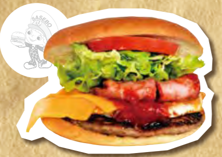
スペシャルバーガー 950円(税込)