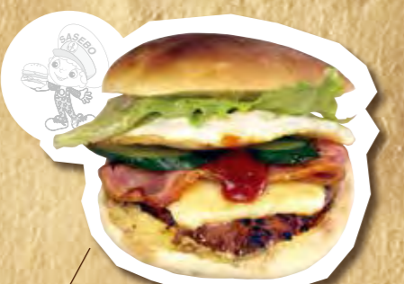
ベーコン、チーズ、エッグバーガー 550円(税込)