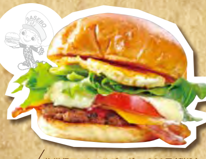
佐世保スペシャルバーガー 680円(税込)