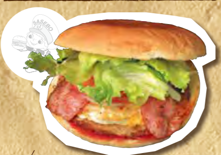
ジャンボチキンスペシャルバーガー 690円(税込)