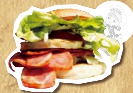
スペシャルルースバーガー 670円(税込)