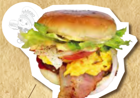
ベーコンエッグチーズバーガー 650円(税込)