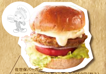
佐世保バーガー(ビッケンスペシャルチーズバーガー) 850円(税込)