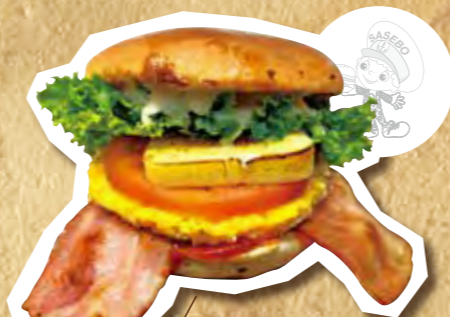
KORON Burger 500円(税込)