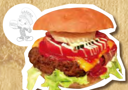
パウンズバーガー 700円(税込)