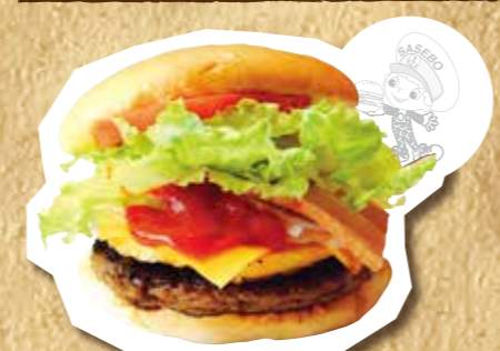
スペシャルバーガー(レギュラー) 950円(税込)