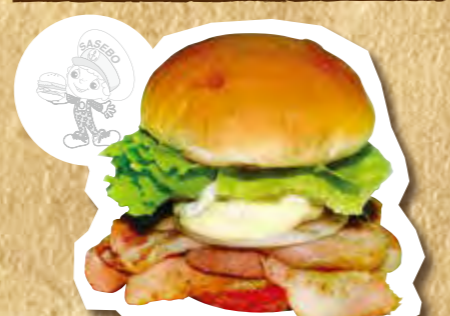
ベーコンエッグバーガー 700円(税込)