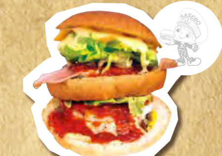
ミサモンスター 680円(税込)