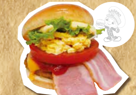
佐世保バーガー 850円(税込)