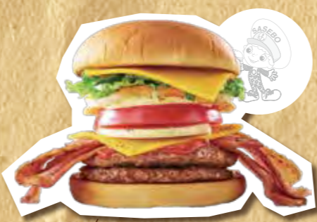
極撰バーガー 1,150円(税込)