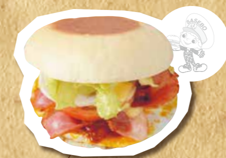
スペシャルバーガー 580円(税込)