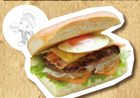
佐世保バーガーカメリア風 フライドポテト付 1,350円(税込)