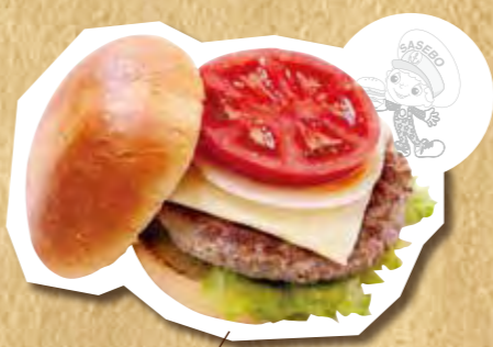
チーズバーガー 750円(税込)