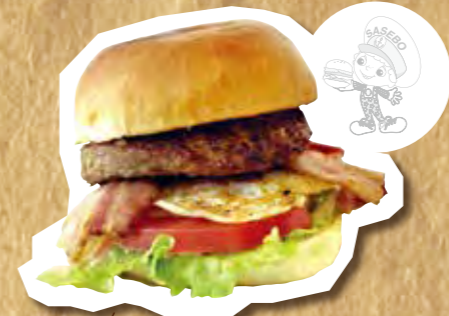
Aikawaスペシャルバーガー 840円(税込)