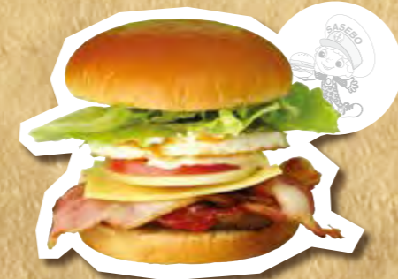
スペシャルバーガー 800円(税込)