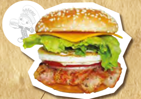
佐世保バーガーC&B 700円(税込)