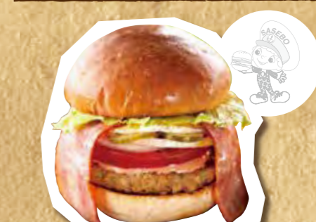
キングダムバーガー 800円(税込)