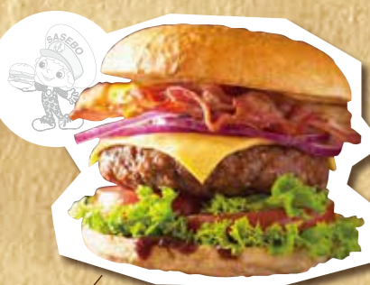
50'sアメリカンスペシャル 700円(税込)