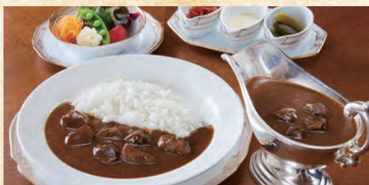
Black Wagyu Beef Curry (with Salad) 黒毛和牛のカレー (サラダ付)