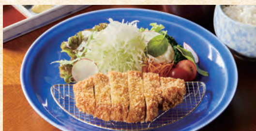
Pork Cutlet (with Rice, Miso Soup, and Pickles) ポークカツ (ご飯・味噌汁・香の物付き)