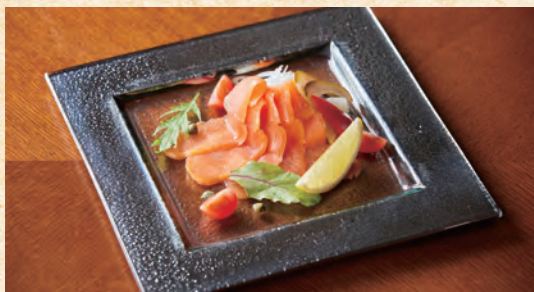
Smoked Salmon and Local Pickled Vegetables スモークサーモンと近郊野菜のピクルス