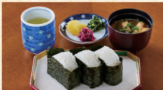
Plum, Salmon, and Kelp Onigiri Set (with Miso Soup and Pickles)