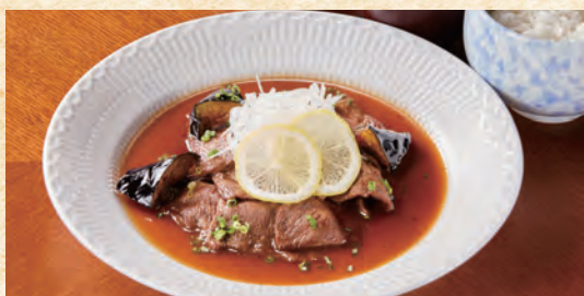
Lemon Steak (with Rice, Miso Soup, and Pickles) レモンステーキ (ご飯・味噌汁・香の物付き)