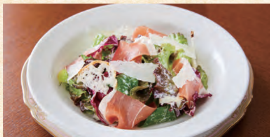
Caesar Salad with Prosciutto 生ハムのシーザーサラダ