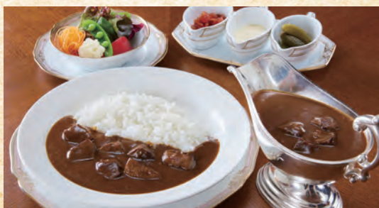
Black Wagyu Beef Curry (with Salad) 黒毛和牛のカレー (サラダ付)