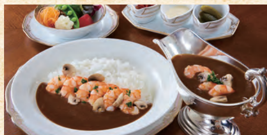
Shrimp and Mushroom Curry (with Salad) 小海老とマッシュルームのカレー (サラダ付)