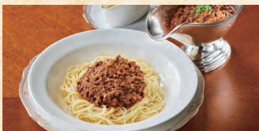
Bolognese Pasta ボロネーズパスタ