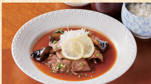
Lemon Steak (with Rice, Miso Soup, and Pickles) レモンスターキ (ご飯・味噌汁・香の物付き)