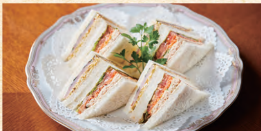
Mixed Sandwich ミックスサンドイッチ