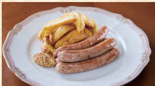
Assorted Sausages and French Fries ソーセージ & ポテトフライの盛り合わせ