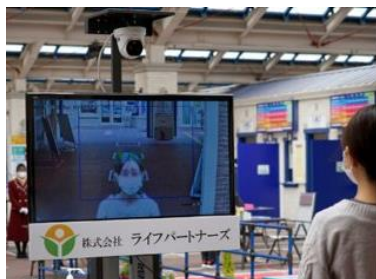
【図 B AI サーモカメラ】