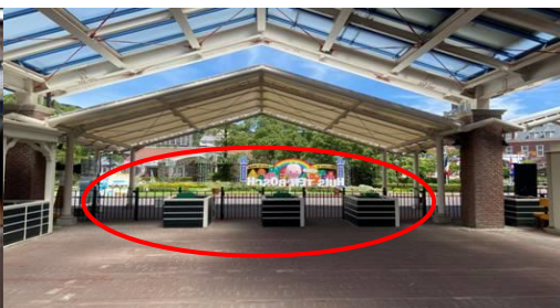
【図 C 修学旅行専用ゲート】