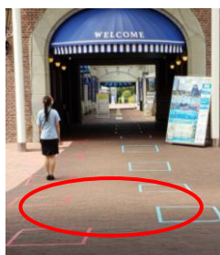
【図 A ソーシャルディスタンス枠】