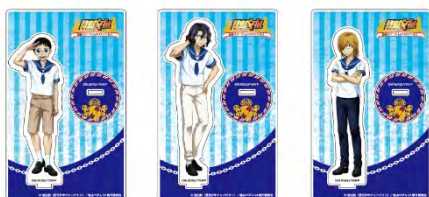
アクリルフィギュア 各¥1,600 (税抜)