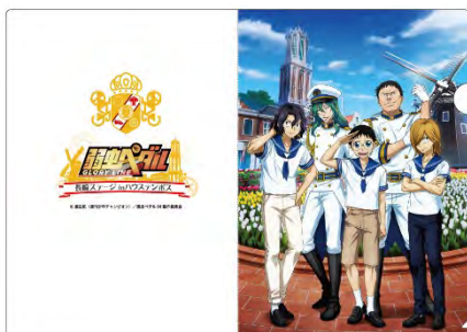
A4クリアファイルA ¥400 (税抜)