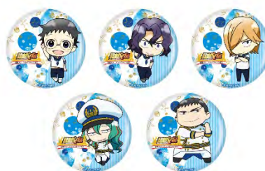
デカ缶バッジ ミニキャラ 各¥600 (税抜)