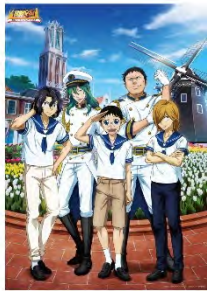
A3 クリアポスター ¥600 (税抜)