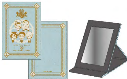
折りたたみミラー ¥2,500 (税抜)