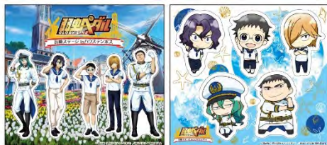
版抜きステッカー2種セット ¥450 (税抜)