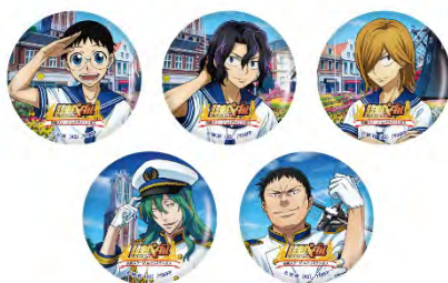
缶ミラー 各¥500 (税抜)