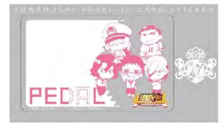
IC カードステッカー ¥600 (税抜)