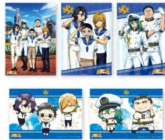
ポストカード5種セット ¥500 (税抜)