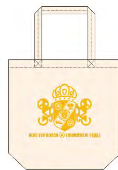
エコバッグ ¥1,200 (税抜)