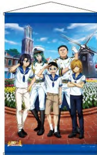
A2 タペストリー ¥2,400 (税抜)