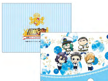
A4クリアファイルB ¥400 (税抜)