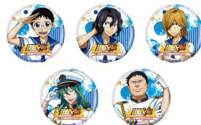
デカ缶バッジ 等身 各¥600 (税抜)