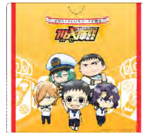
オリジナルチケットホルダー

参加料 500 円の“合宿費”を払って体験できるスタンプラリーを実施。スタンプを全部集めた方には、『オリジナルチケットホルダー』をプレゼント