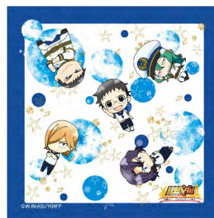
マイクロファイバータオル ¥700 (税抜)