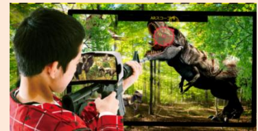
▲武器に装着された“ARスコープ”をのぞくと、そこに見えるのは恐竜たちがうごめく世界！

無人島に生息する肉食恐竜に挑むARシューティングゲーム。 今回のミッションのために開発された特殊な“武器”を手に、無人島を探索。あなたは島に眠る財宝を探し出すことができるか！？