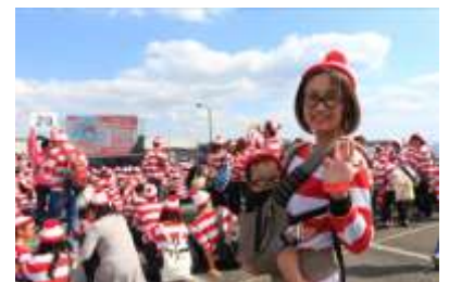
※画像は昨年のももの

長崎・ハウステンボスでは2017年10月8日(日)、「ウォーリーをさがせ!」のウォーリーに仮装した人々を3873人以上※集め、ギネス世界記録に挑戦するイベントを開催いたします。今回が3回目の挑戦となり、過去2015年は3316人、2016年は3856人、3度目の挑戦の今年こそ記録達成を目指します。(※現在の世界記録は2011年に、アイルランド・ダブリンで記録された3872人)