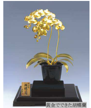
黄金でできた胡蝶蘭