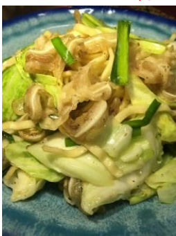
『ミミガーの ウチナー塩焼きそば』 ／月うさぎ

コリコリの県産ミミガー（豚の耳）ともちもちの沖縄そばの麺を使った塩焼きそば。やみつきになりますよ！『でーじまーさん（とってもおいしい）』