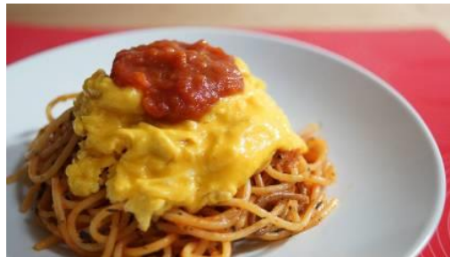
『ふわとろ卵と ピュアマトソースの焼きパスタ』 ／ピアンカ・ママの焼きパスタ

濃厚な麺の旨味とピュアマトの酸味がふわとろ卵と合わさって最高！世界で唯一の調理法！これが真の焼きパスタ！！