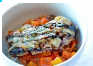
【第4回九州ご当地グルメ王者決定戦グルメ部門優勝】 【第1回全国グルメFIGHT2015 ～肉の巻～グルメ部門優勝】 『雲仙しまばら鶏のイタリア丼』/ ウォーターマークホテル長崎ハウステンボス