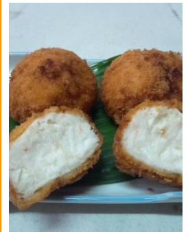
『かにコロケ』 ／徳なが