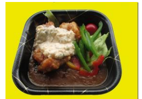
【宮崎県商工会連合会主催 グルメコンテスト優勝】 『チキン南蛮カレー』/ カレー専門店トプカ あいもこいもかふえ