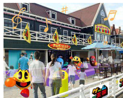
【パックマンランド イメージ】