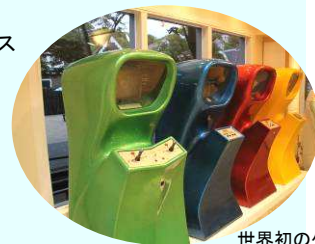
世界初のゲーム機 「COMPUTER SPACE」 全4色を日本初の同時展示！

スペースインベーダー、PART II アルカノイド マリオブラザーズ ドンキーコング JR. コンピュータスペース ゼビウス ムーンクレスタ ペンゴ いっき グラディウス II 熱血硬派くにおくん ファイナルファイト バーチャファイター2 鉄拳 ぷよぷよ通 アフターバーナー