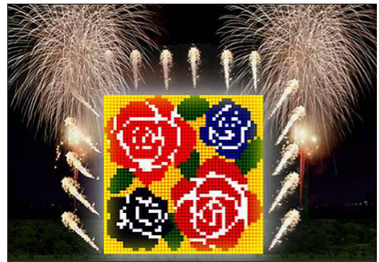
※バラのアート花火イメージ

ぜひ、毎夜ライトアップされるナイトローズと合わせて、スペシャル花火を見て、参加して「バラ祭」の魅力を感じてください。