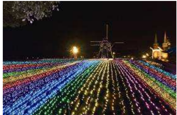
【光の아트ガーデンの“クリスタルブルーウェーブ”】