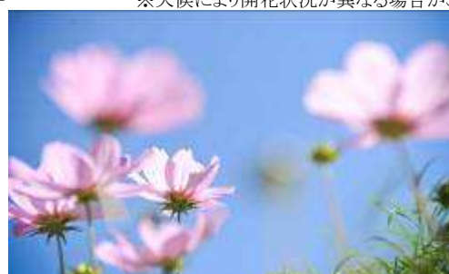
アレキサンダー広場