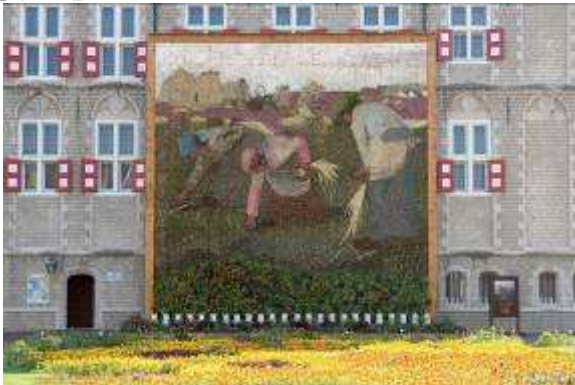
花の壁画【8m×9m】 作品:ゴッホの自画像