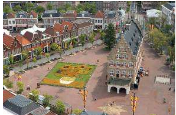
花の地上絵【24m×19m】 作品:ゴッホのひまわり