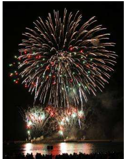
▲第3回世界花火師競技会決勝オーストラリアの花火

決勝戦は、2012年9月22日(土)。日本代表と海外代表が世界最高峰の技を競い合い、世界一の花火師が決定します。