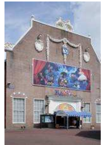
↑旧フライトオブワンダー

世界で唯一、ハウステンボスだけ体験できる「サウザンド・サニー号クルーズ」と共にワンピースの世界観を満喫! 夏休みのハウステンボスの目玉として登場する「ワンピース ライドクルーズ～for the new world～」にぜひ、ご注目ください。