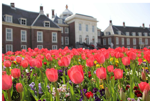
パレスハウステンボスの様子