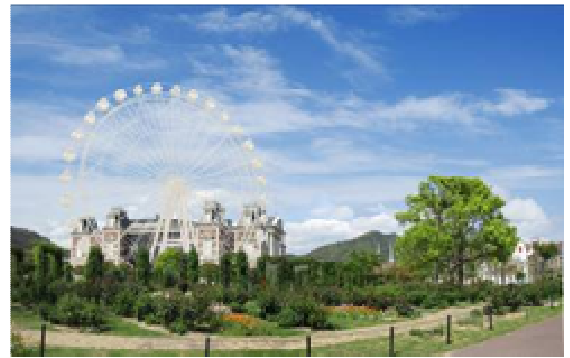
【11月25日オープン予定の観覧車イメージ】

このようなイルミネーションを陰で支えるのが、エコシティハウステンボスのインフラです。大規模の太陽光発電システムと天然ガス コ・ジェネレーションシステム 2 つの発電能力は最大 5400KW で、800 万球以上の電力をまかなうことができます。